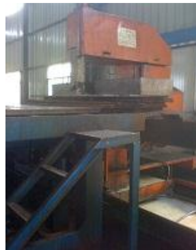
大型のご盤による厚板切断